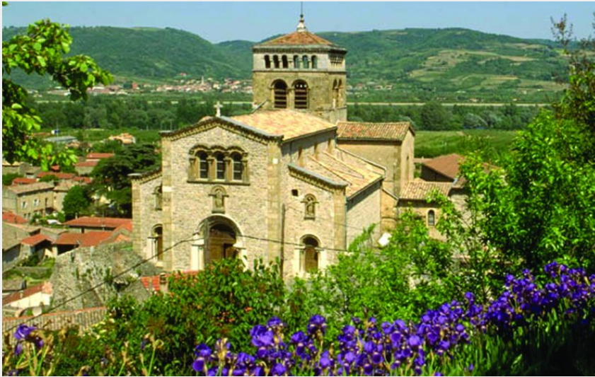
Eglise romane de Vion (Ardèche Hermitage Tourisme)