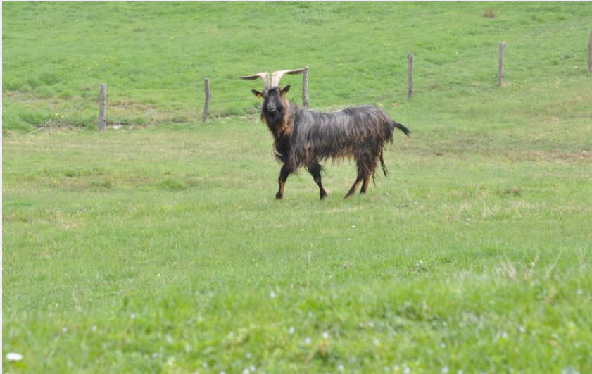
Bouc dans un pré