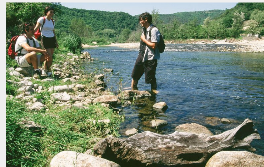
Bords du Doux (Ardèche Hermitage Tourisme)