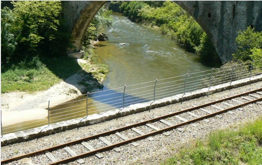
Le Grand Pont sur le Doux