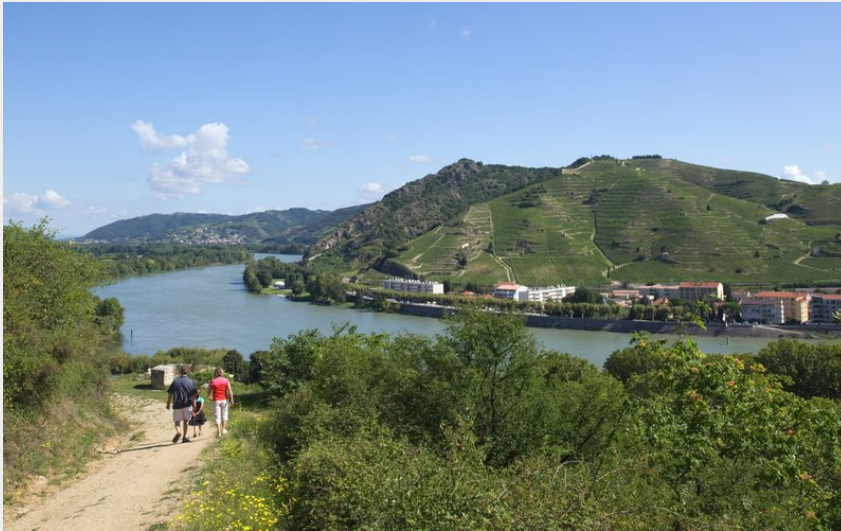
Sentier des tours