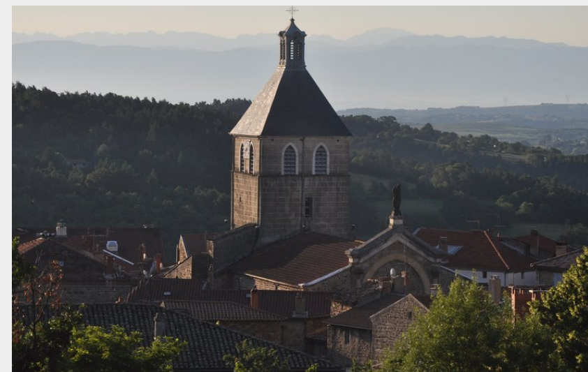
Clocher de Saint Félicien