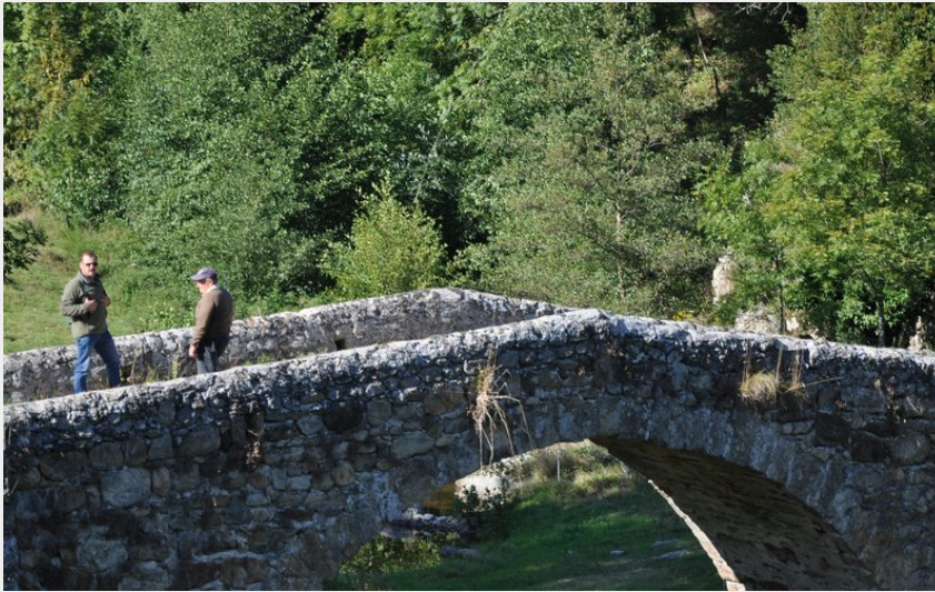
Pont du Moulin des Gaillards