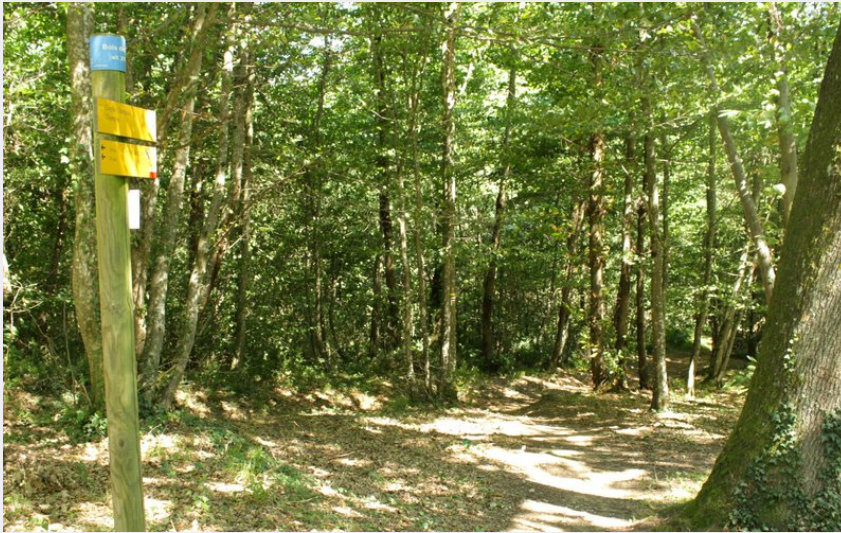
Bois de Sizat