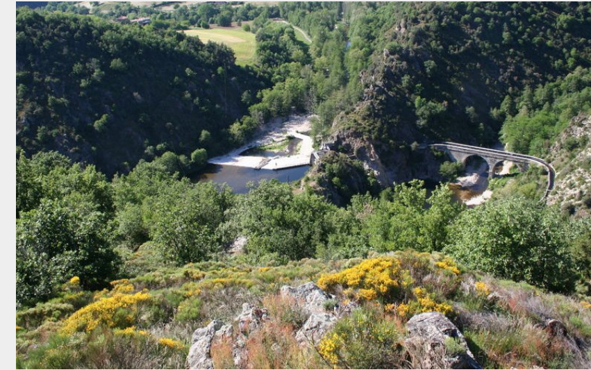
Vue sur le Doux (Ardèche Hermitage Tourisme)