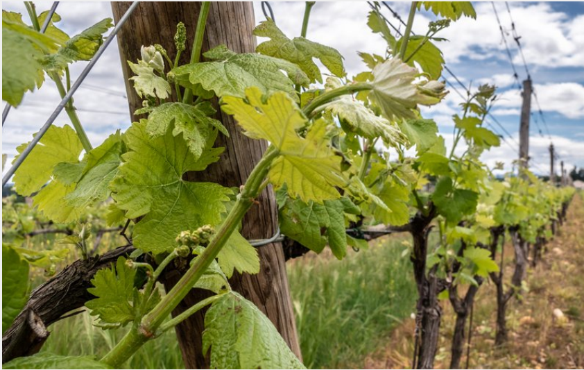
Plaine viticole de Beaumont Monteux (Ardèche Hermitage Tourisme)