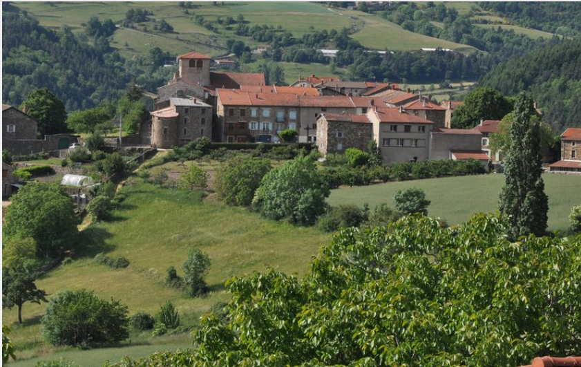
Vue du village de Pailharès (Ardèche Hermitage Tourisme)