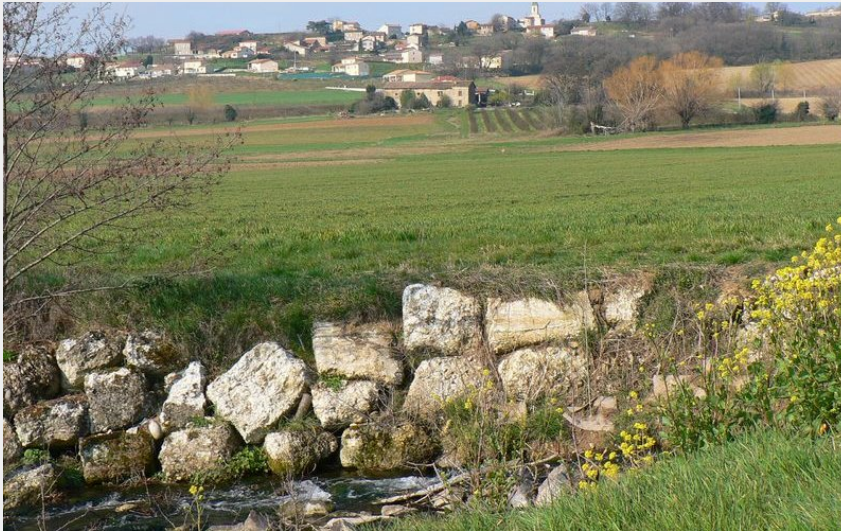
Village de Veauues (Ardèche Hermitage Tourisme)