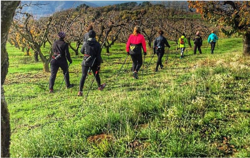
Randonnée hivernale (arche-agglo-admin)