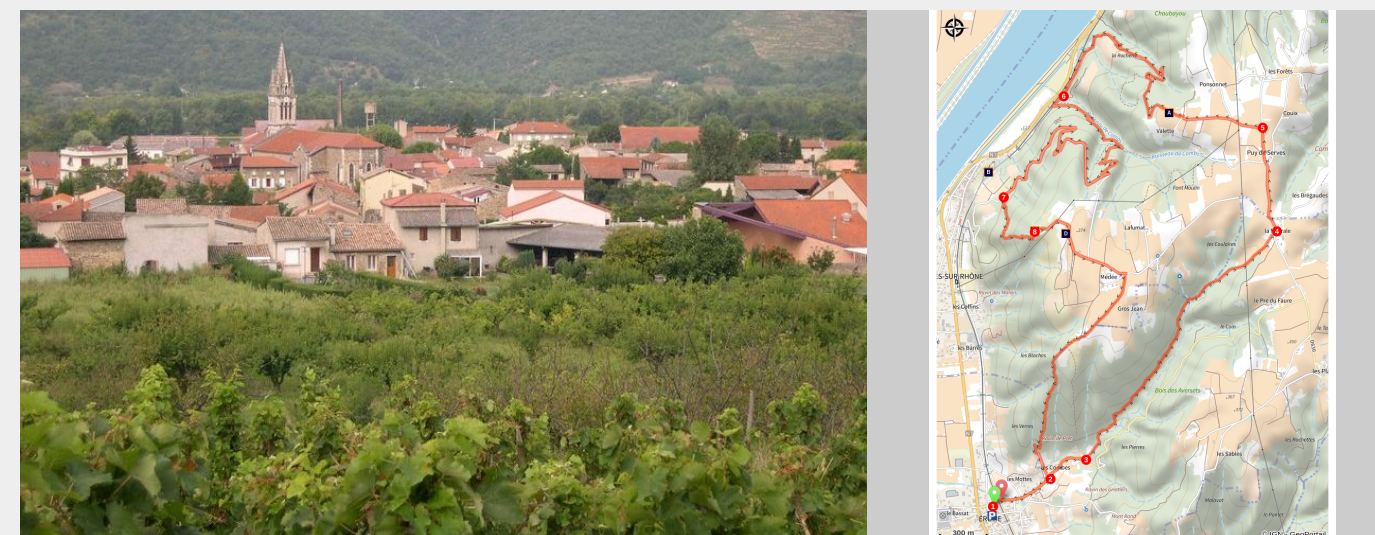
Village d'Erôme (Ardèche Hermitage Tourisme)

Cette boucle par le chemin vieux et le belvédère de Servas propose des panoramas sur la Vallée du Rhône, les montagnes ardéchoises et même le Vercors, à travers parfois, une végétation aux parfums méditerranéens.