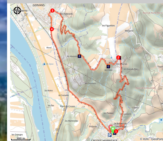
Les Méjeans (Ardèche Hermitage Tourisme)

De Crozes à Gervans par le belvédère des Méjeans. Magnifique panorama sur la Vallée du Rhône, Tain l'Hermitage et les premiers contreforts de l'Ardèche.