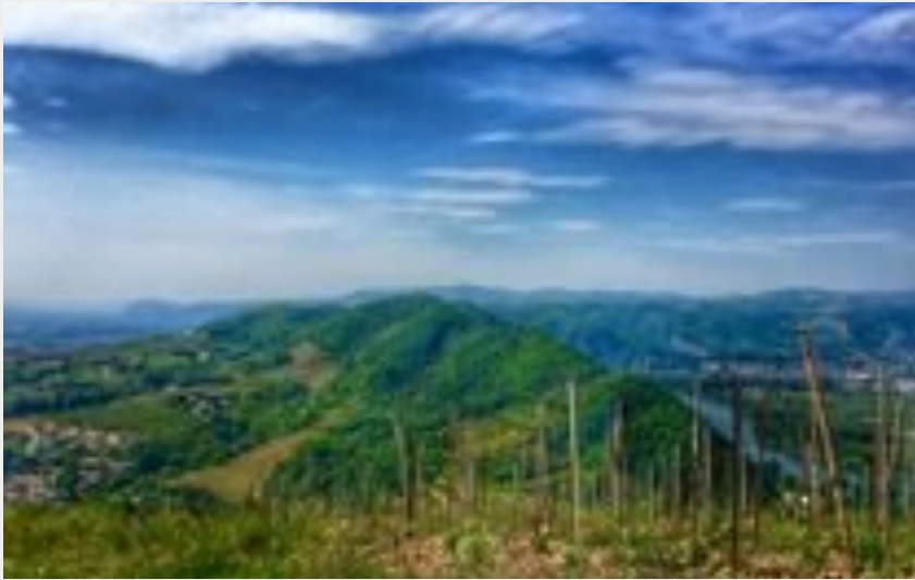
Les Méjeans