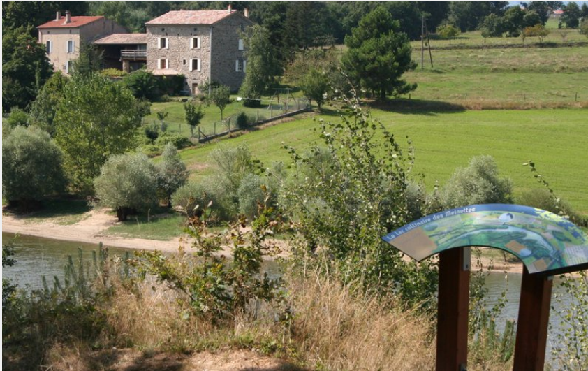
Panneau d'interprétation au bord du lac