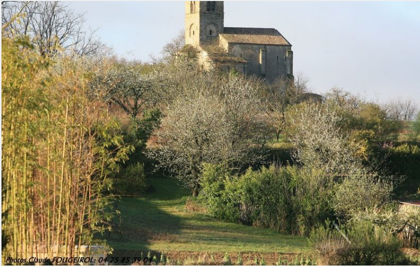
Eglise de Chantemerle les Blés