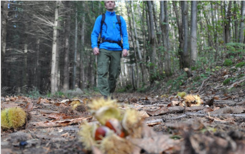
Chemin antique du Bois de Malaurier (Ardèche Hermitage Tourisme)