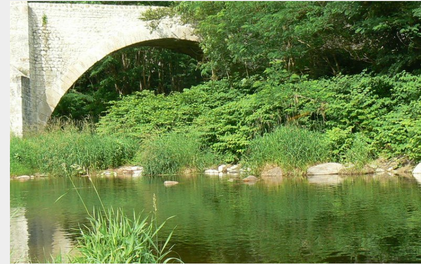
Pont du Roi