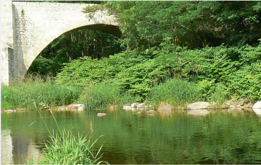
Pont du Roi (Ardèche Hermitage Tourisme)