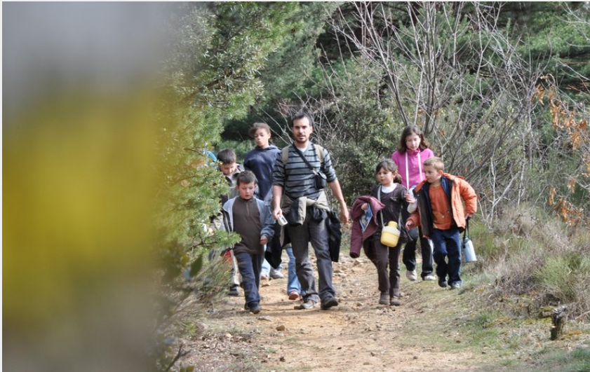
Chemin à proximité de Malgaray